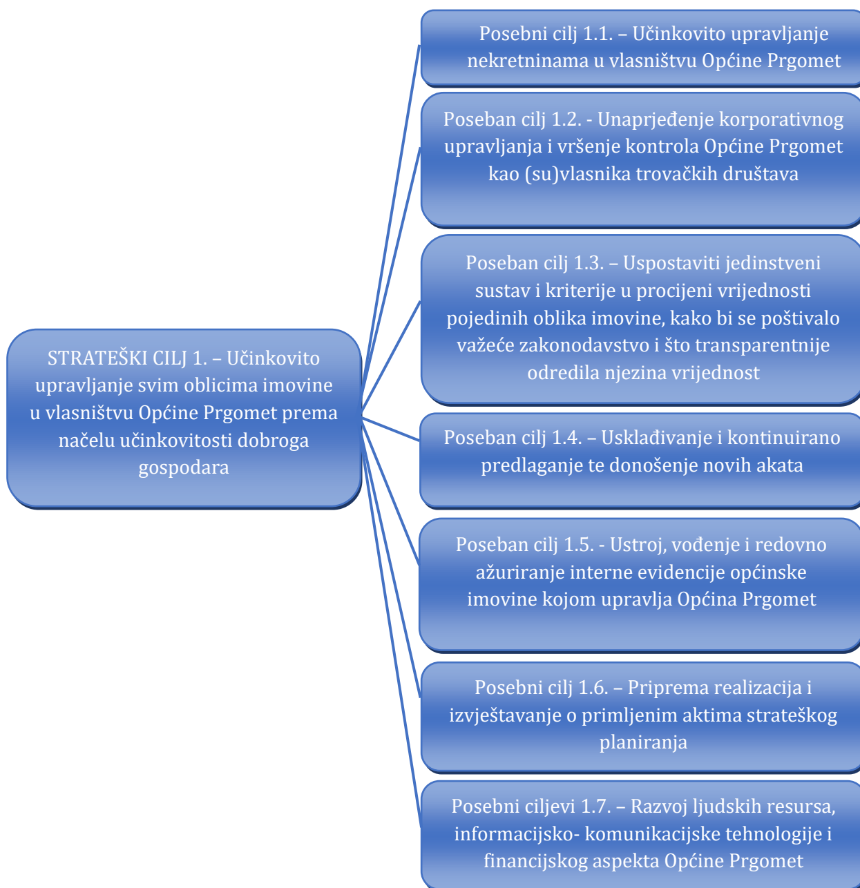
Slika 2. Kaskadiranje strateškog cilja upravljanja općinskom imovinom